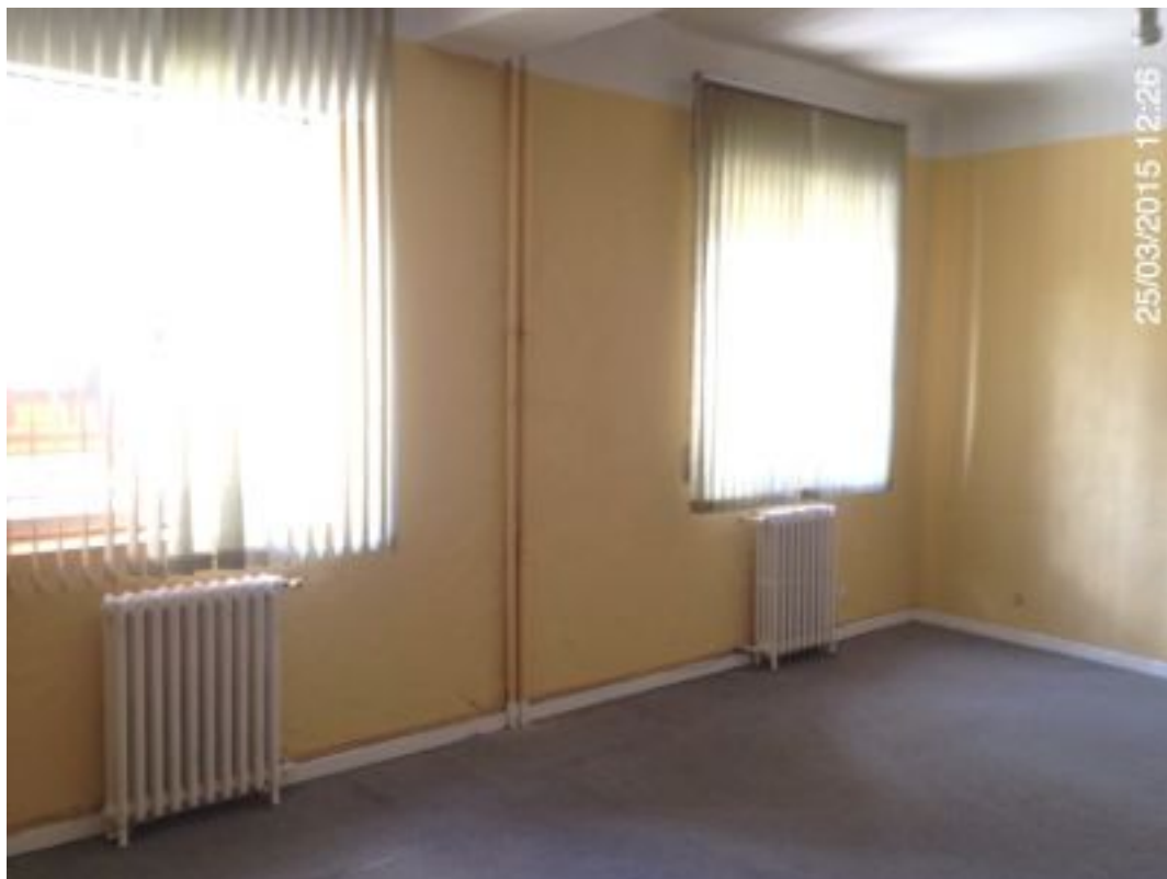
despacho 5 a.jpg