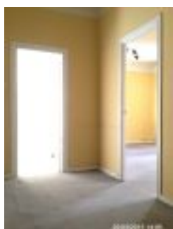
distribuidor central fondo.jpg

Zona: Chamartín Tipo: Venta Pisos Dirección: Joaquin Costa Precio: € EUR 449,000 Superficie: 135 m2 Nº de habitaciones: 4 Codigo Postal: 28002 Población: Madrid Description: