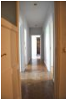
Pasillo desde fondo.JPG

Zona: Chamartín Tipo: Venta Pisos Dirección: Joaquín Costa Precio: € EUR 399,000 Superficie: 124 m2 Nº de habitaciones: 3 Código Postal: 28002 Población: Madrid Description: